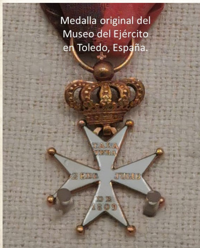
Medalla original del Museo del Ejército en Toledo, España.

La mayoría de los grandes hombres de la historia de las naciones, no han tenido en vida el reconocimiento de sus contemporáneos y sólo después de muchos años el tiempo les ha reconocido sus méritos.