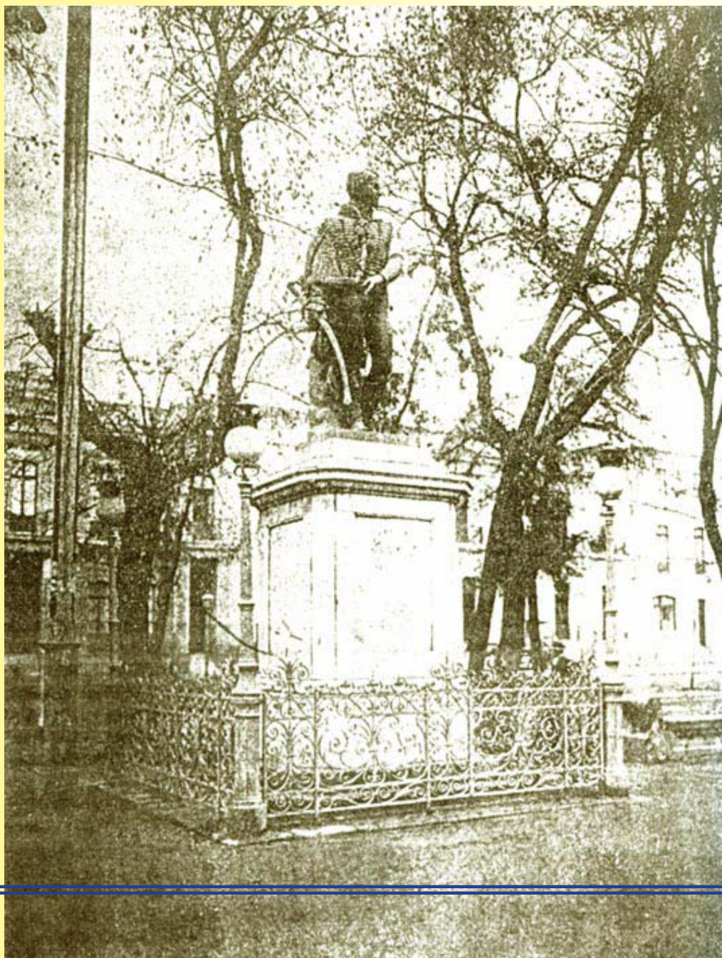
Antigua ubicación de la estatua del General José Miguel Carrera en la Alameda de las Delicias.

Aquella avenida se vio posteriormente transformada, en la década de 1930, por la construcción del gran proyecto arquitectónico del Barrio Cívico, con el Palacio de La Moneda como su centro, destinado a albergar las oficinas y ministerios del gobierno. Las estatuas ecuestres a los Próceres O'Higgins y San Martín, entonces ubicados el uno frente