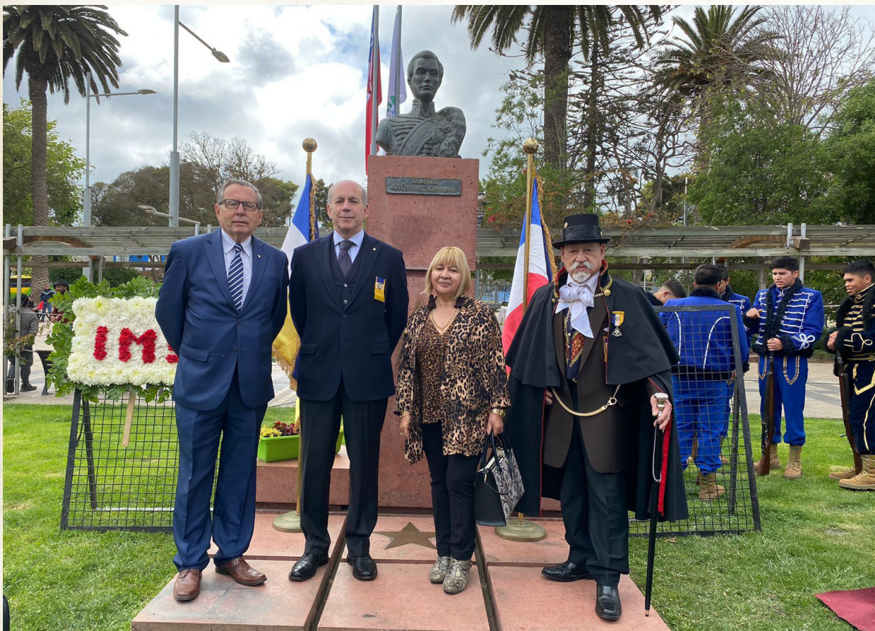
Finalización de la ceremonia del natalicio del prócer José Miguel, en su busto de Llo-lleo, comuna de San Antonio.