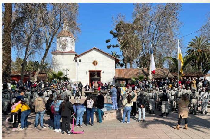
Público en la Plaza de El Monte.