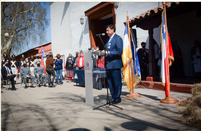
Discurso del Alcalde de El Monte, don Francisco Gómez Ramírez.