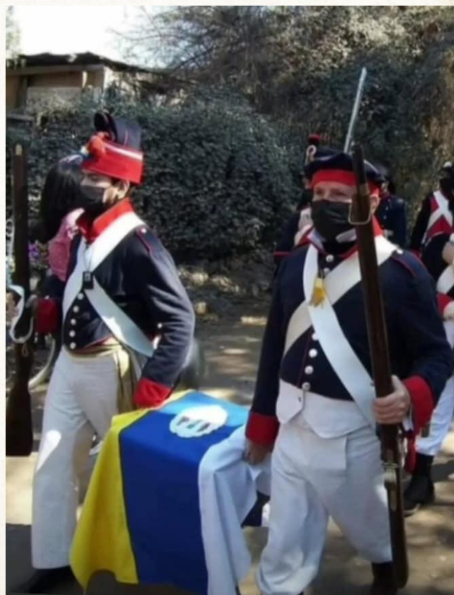
Recreación del traslado de los restos del Prócer.

Posteriormente, los recreacionistas cargaron un féretro en el que supuestamente iban los restos de Carrera con rumbo a la Hacienda de San Miguel, a la que fue su casa solariega.