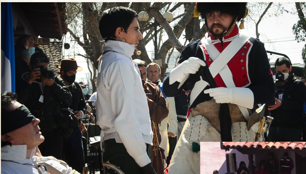
Momentos previos al fusilamiento.