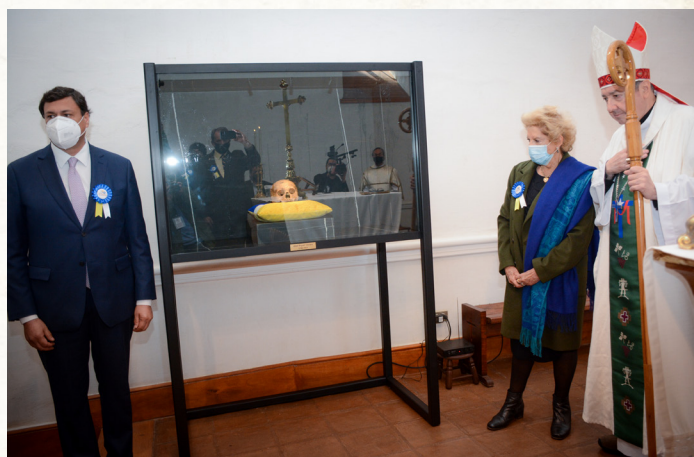
Bendición del osario.