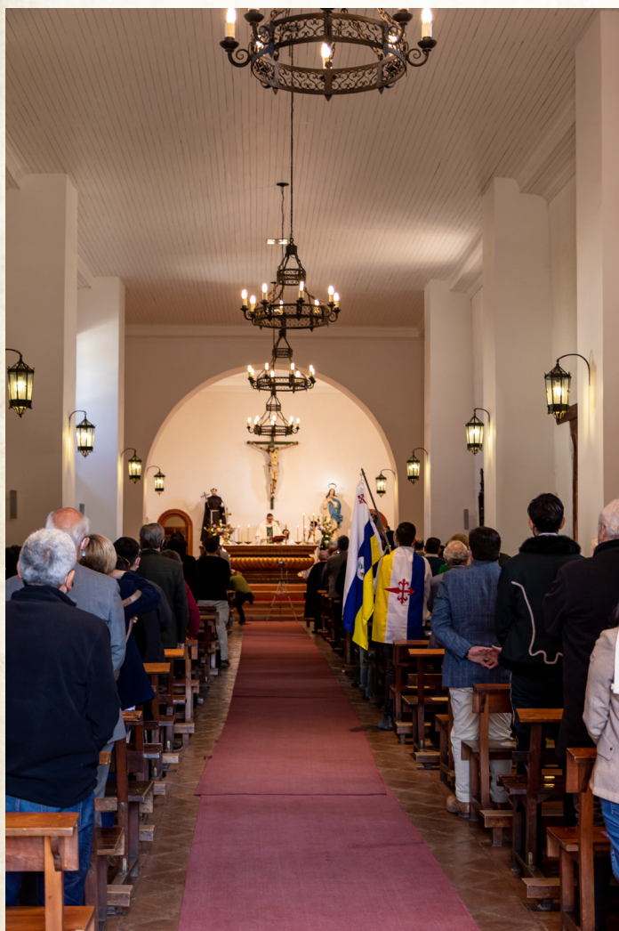
Misa solemne en la Parroquia San Miguel de El Monte: Este acto solemne se realizó en El Monte, Melipilla, y comenzó con una misa del Obispo Monseñor Cristián Contreras, durante la cual se inauguró un osario para contener el cráneo del Prócer.

A continuación, dejamos un estimonio gráfico de lo que fue tan importante actividad conmemorativa.