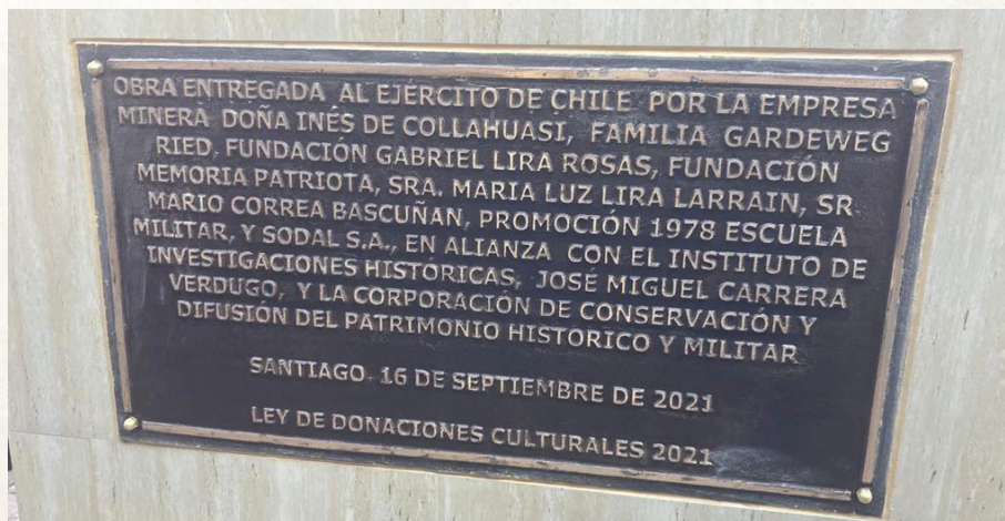
Placa conmemorativa, en el plinto del monumento.

La obra contribuye, de esta forma, a la identidad del edificio que a partir de hoy se denominará “Edificio Ejército Bicentenario