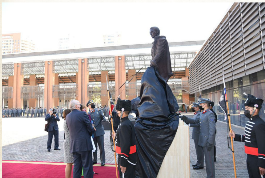
Momento preciso de la desvelación de la estatua.