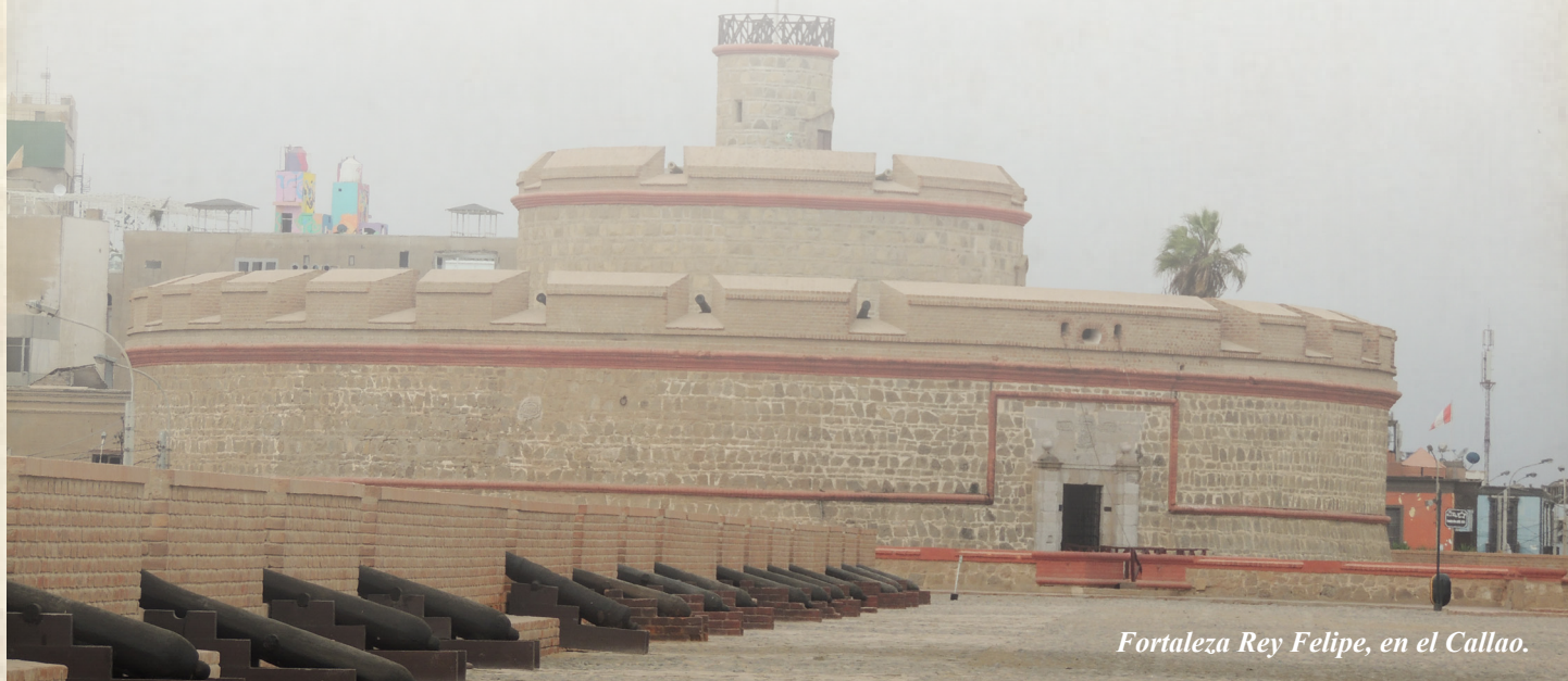
Fortalezuela Rey Felipe, en el Callao.