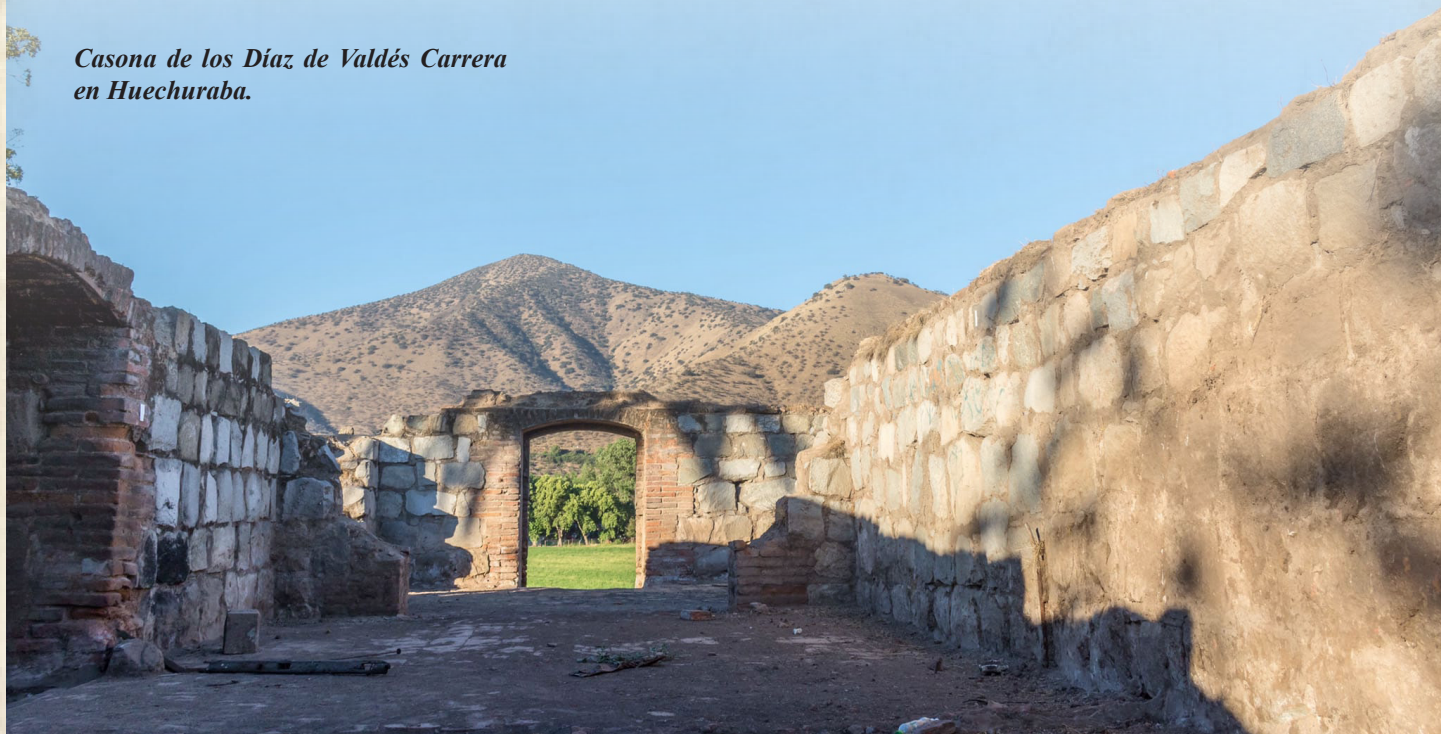
Casona de los Díaz de Valdés Carrera en Huechuraba.