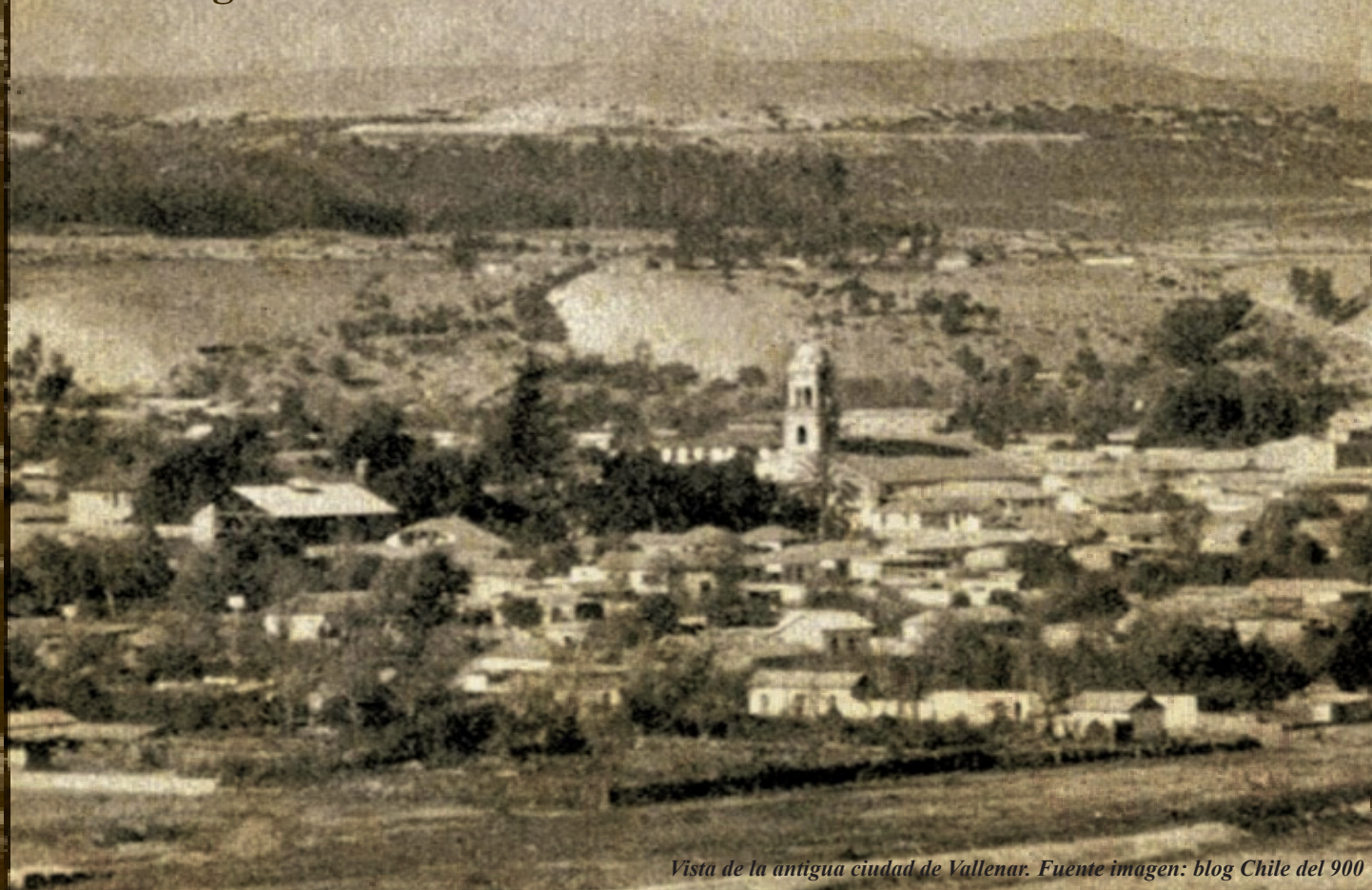
Vista de la antigua ciudad de ValLENAR.