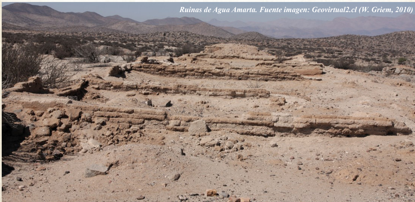
Ruinas de Agua Amarta.