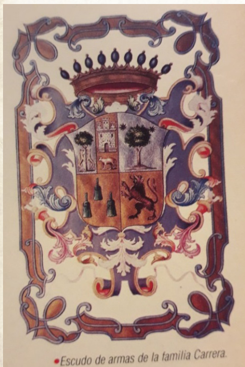
• Escudo de armas de la familia Carrera.

disciplina con ambigüedades e incertidumbre en varios casos. Hay apellidos que suelen tener más de un escudo, y en el caso de los aristócratas, estos solían tener más de un emblema heráldico: el de su apellido, y el de su título nobiliario.