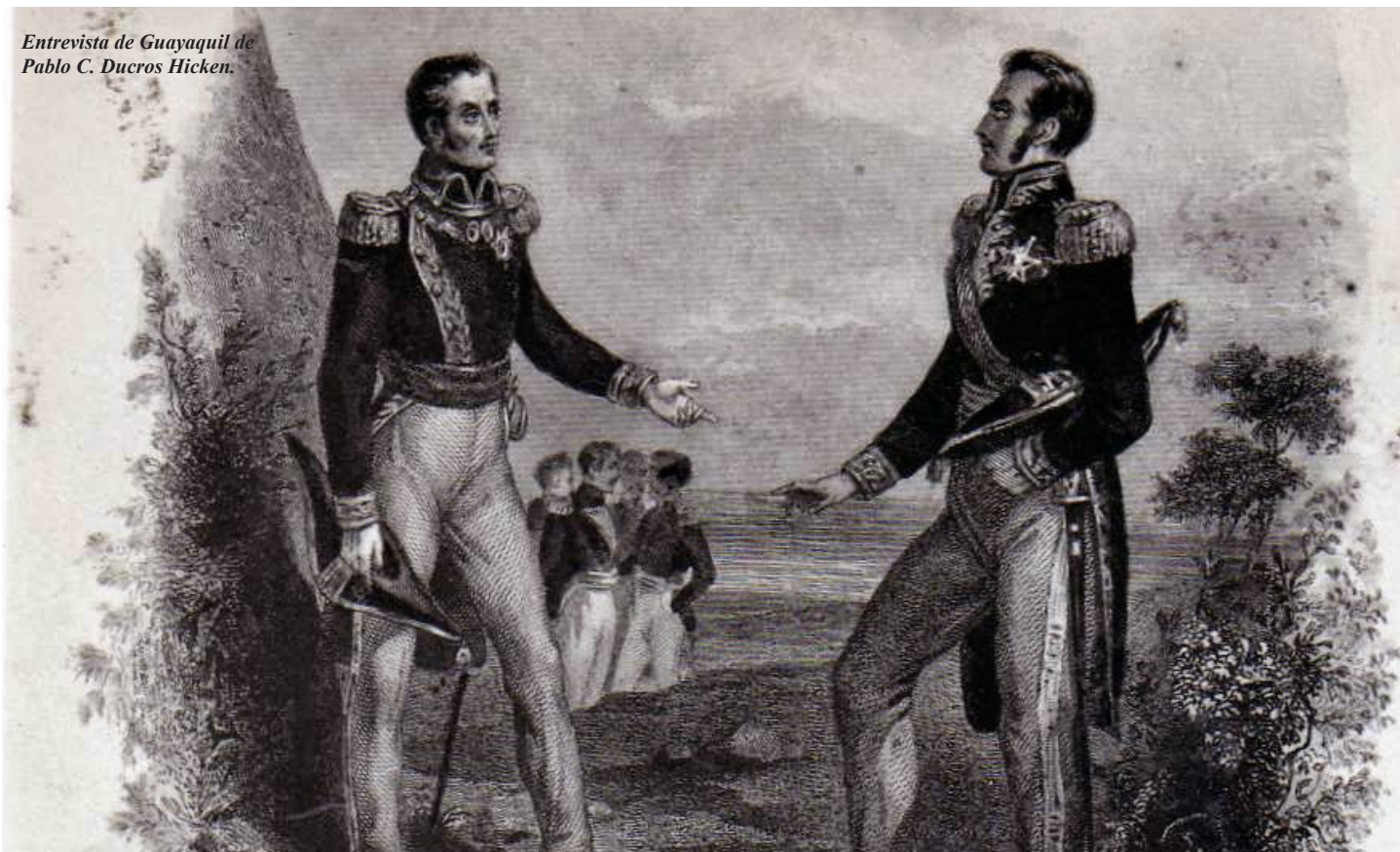
Entrevista de Guayaquil de Pablo C. Ducros Hicken.