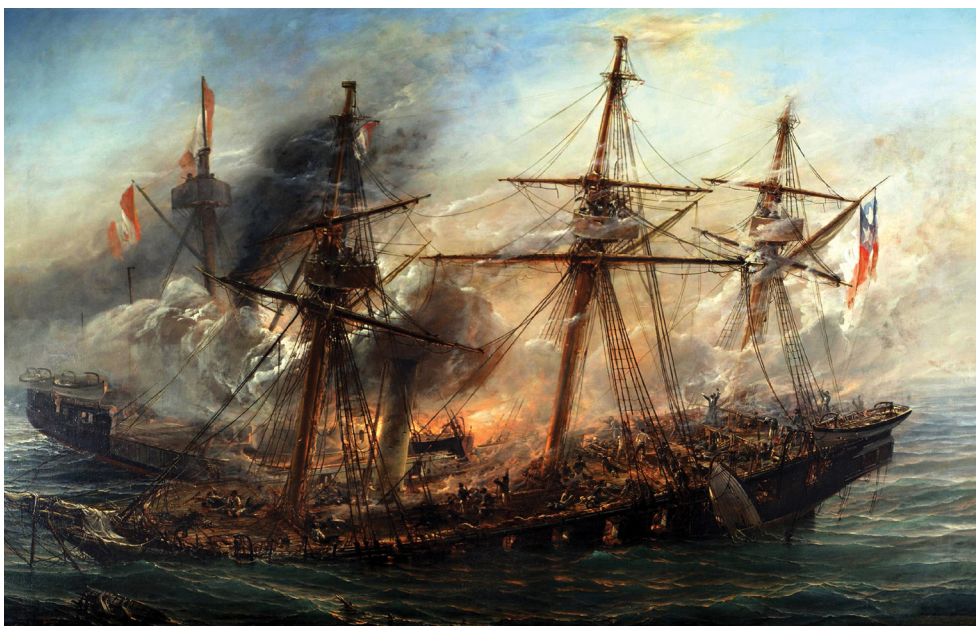
Cuadro de Tomas Somerscales

Esta derrota bélica es aparente, pues todos olvidan u omiten destacar que el Capitán Carlos Condell, al mando de la Goleta Covadonga, siguiendo las instrucciones de Prat, con una inteligencia táctica sobresaliente, condujo su liviana nave hacia sectores con poco fondo cercanos a los roqueros del borde costero de Punta Gruesa, logrando con ello que la vigorosa y acorazada Independencia encallara en forma definitiva, siendo posteriormente incendiada por la tripulación del Huáscar por órdenes de Grau quien la vió irremediablemente perdida. Chile había perdido un barco débil y antiguo, pero Perú perdió a uno de sus barcos más modernos y poderosos recientemente reacondicionado y reforzado para la guerra.