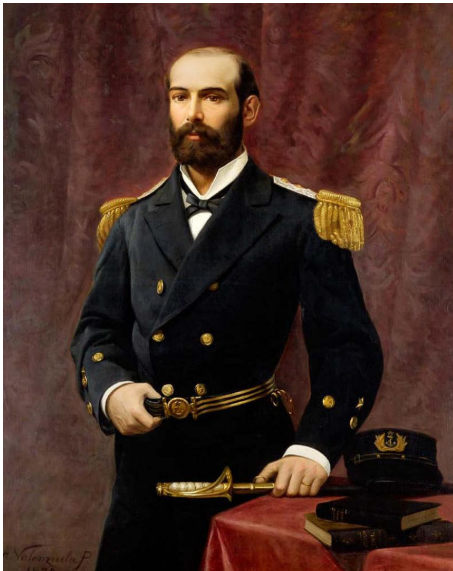
Retrato del Capitán Arturo Prat, por Valenzuela Puelma.

Con las reformas a la Constitución Política del Estado