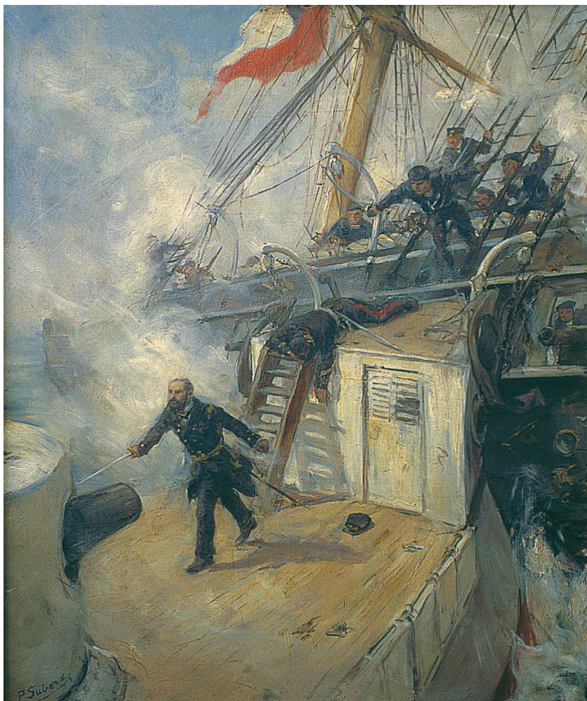
Abordaje de Arturo Prat, por Fray Pedro Subercaseaux