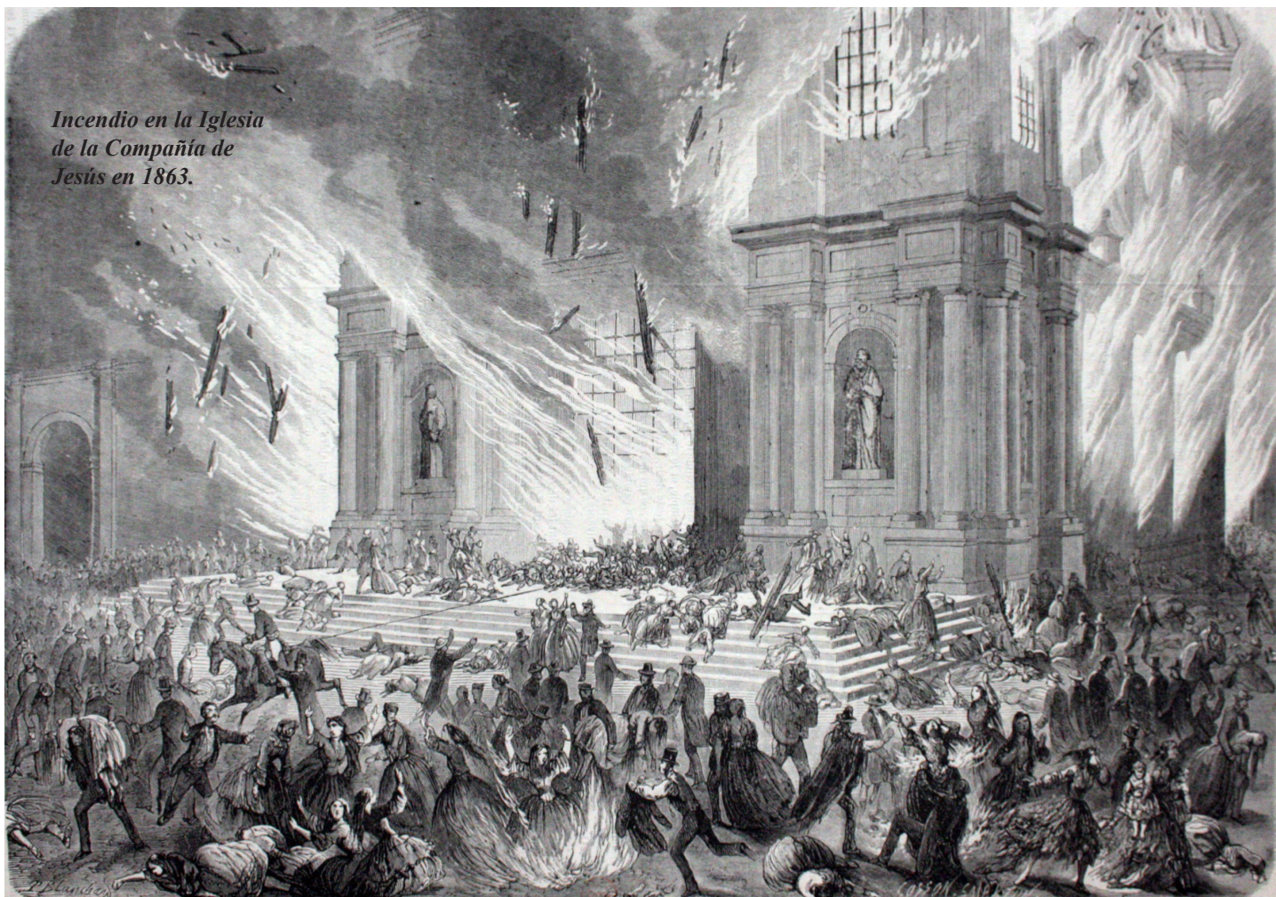
Incendio en la Iglesia de la Compañía de Jesús en 1863.

característica que por 150 años han adornado a los Cuerpos de Bomberos Voluntarios de la República de Chile, predicando con su ejemplo fraternal la pacificación de los ánimos, la tolerancia de las ideas ajenas y la desinteresada ayuda al prójimo.