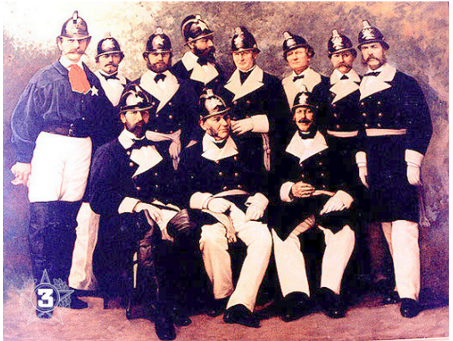
Fundadores del Cuerpo de Bomberos de Santiago en 1863

Art. 9 Se formará una Compañía que denominará de Incendio y se compondrá de 1 comandante, 1 sargento, 8