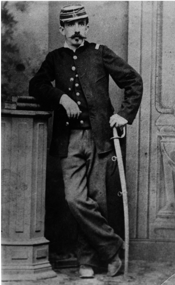
El héroe y nieto de José Miguel Carrera, Ignacio Carrera Pinto, fue voluntario de la Segunda Compañía de Bomberos Esmeralda.

Art. 3 Las Compañías se distinguirán por su orden numéricos; i cada una de ellas constará de un Capitán, dos T, dos Subtenientes, dos Sargentos de 1a Clase, seis id. de 2a, seis Cabos 1, seis id. 2, i la tropa que pudiese alistarse, no excediendo de 100 plazas.