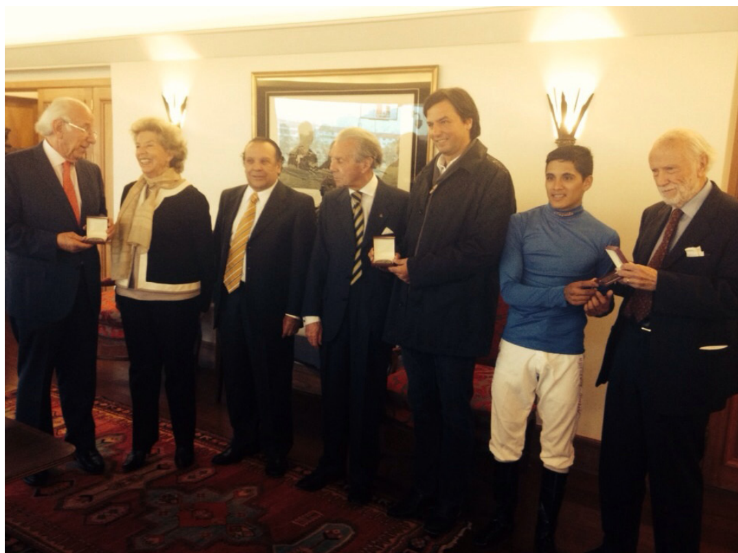
La Presidenta y algunos Directores entregan los premios al preparador, al jinete y al dueño del caballo "Clark Gable"