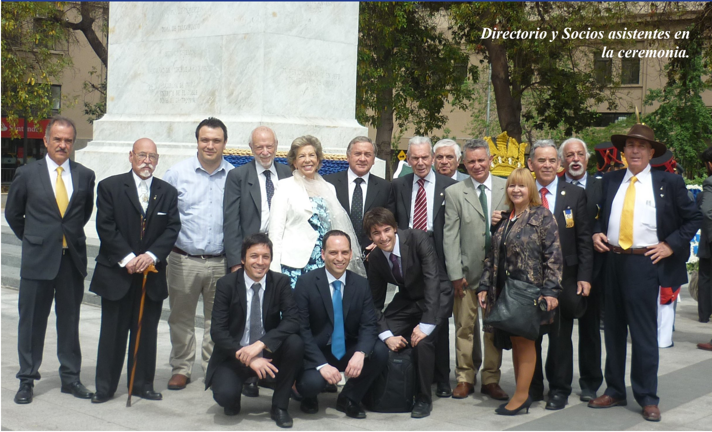
Directorio y Socios asistentes en la ceremonia.