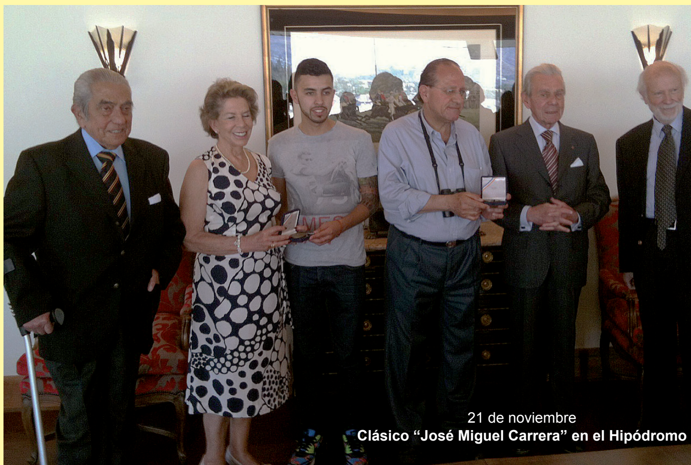
21 de noviembre Clásico "José Miguel Carrera" en el Hipódromo